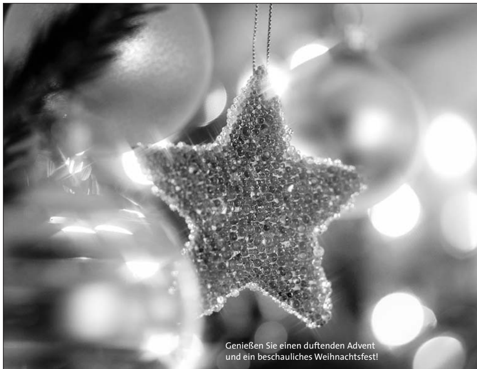
Genießen Sie einen duftenden Advent und ein beschauliches Weihnachtsfest!