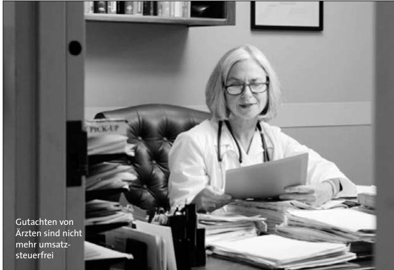
Gutachten von Ärzten sind nicht mehr umsatz- steuerfrei