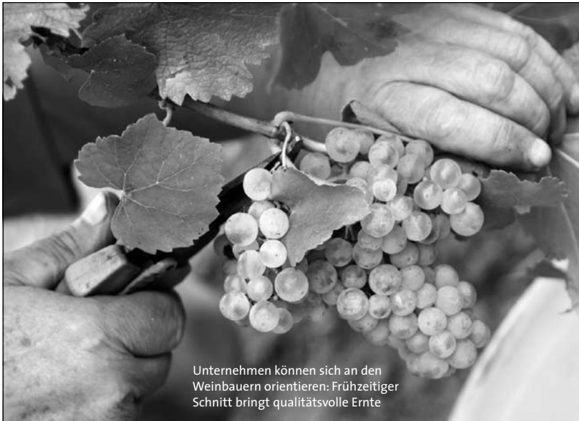
Unternehmen können sich an den Weinbauern orientieren: Frühzeitiger Schnitt bringt qualitativvolle Ernte