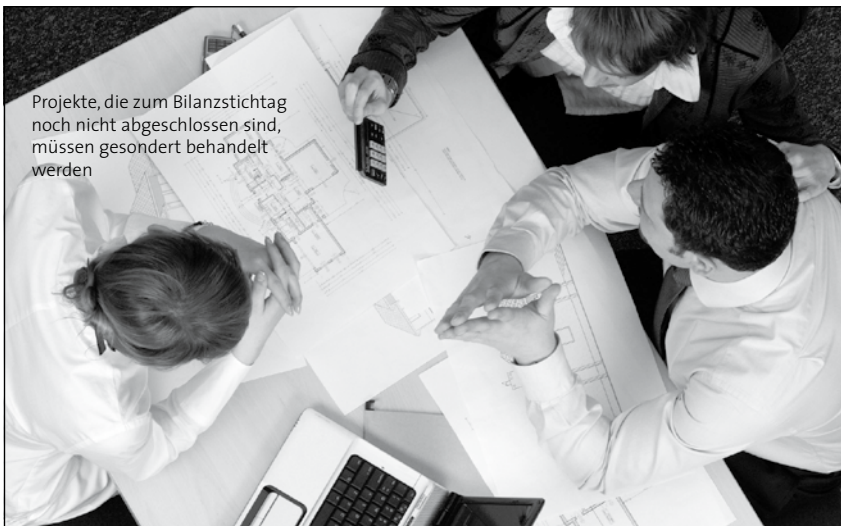
Projekte, die zum Bilanzstichtag noch nicht abgeschlossen sind, müssen gesondert behandelt werden