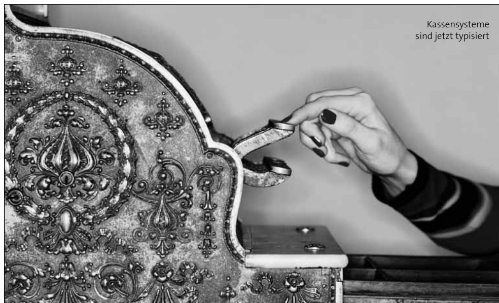
Kassensysteme sind jetzt typisiert