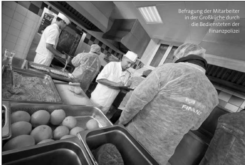
Befragung der Mitarbeiter in der Großküche durch die Bediensteten der Finanzpolizei